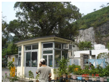
タイラム女性刑務所入り口